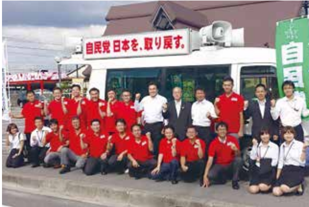
青年局・青年部・学生部との街頭活動