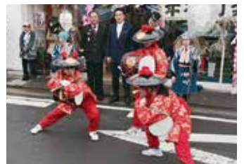
豊川市若葉祭(うなごうじまつり)