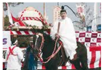
尾張二宮大縣神社 献餅奉納・献馬奉納