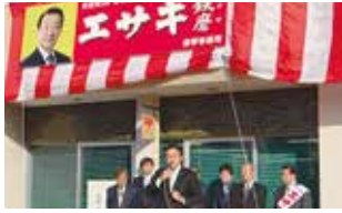
愛知10区江崎代議士応援