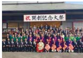
成田山名古屋別院 開創記念大祭