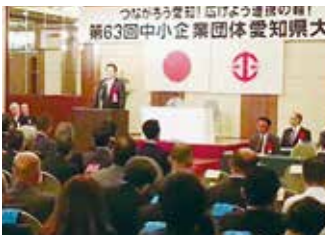
中小企業団体愛知県大会