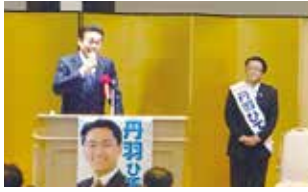
愛知6区丹羽代議士応援