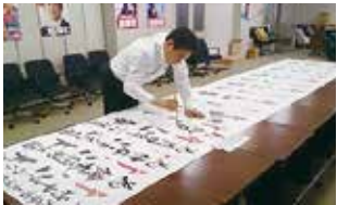
必勝ビラの作成風景