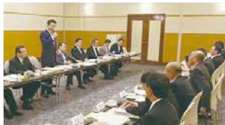
県内の各市町村長からご要望を伺う地域連絡会議