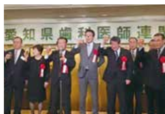
愛知県歯科医師連盟新年懇親会