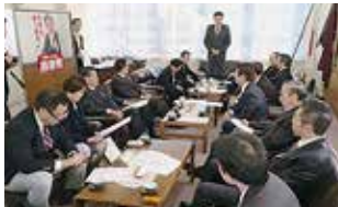
県連において執行部会