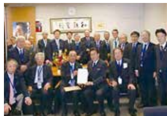
愛知県商工会連合会ご要望