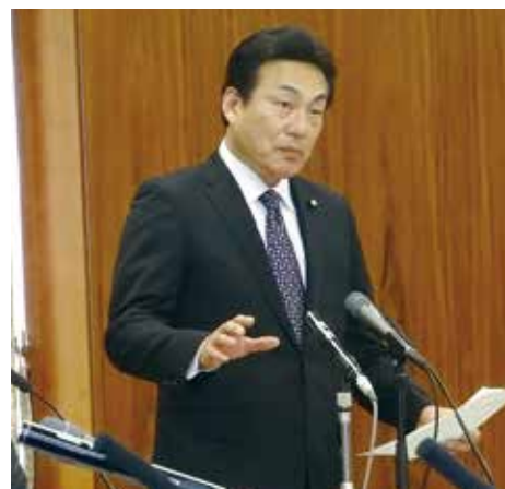
総務委員会にて質問。地方税法・地方交付税法・NHK 予算を年度内に可決・成立