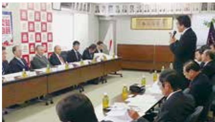
各団体の皆様からご要望を伺う政策懇談会