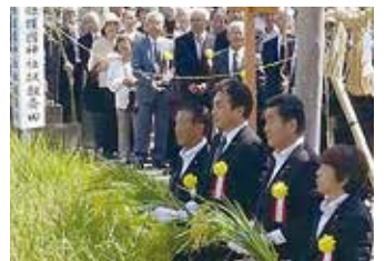
愛知県護国神社献穀事業「抜穂祭」