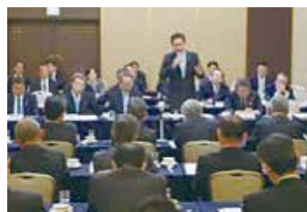
愛知県農業協同組合との意見交換会