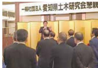
愛知県土木研究会懇親会