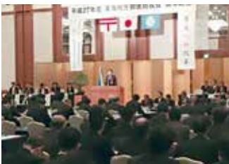
東海地方郵便局長会総会