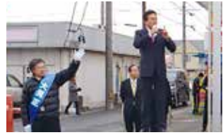
愛知13区大見代議士応援