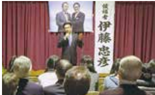
愛知8区伊藤代議士応援