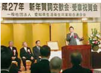
愛知県生活衛生同業組合連合会新年賀詞交歓会