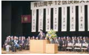
愛知12区青山代議士応援