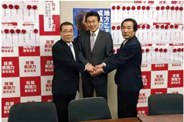
統一地方選挙投票日の自民党県連にて