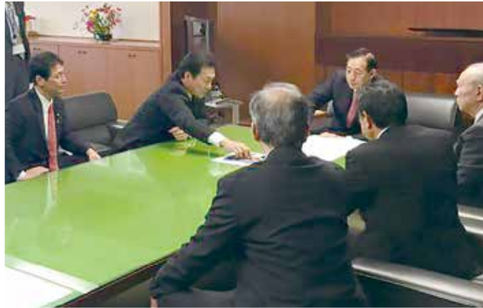
名古屋商工会議所、名古屋港管理組合の皆様と太田国土交通大臣へ要望