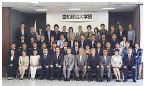
第14期愛知政治大学院が過去最多となる94名を迎えてスタート