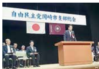
自民党岡崎市支部総会