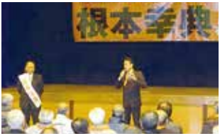
愛知15区根本代議士応援