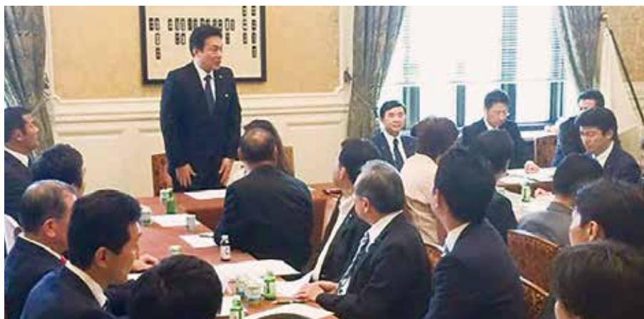
参議院自民党国会対策委員会にて副委員長を拝命