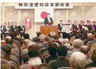
神政連愛知県本部総会