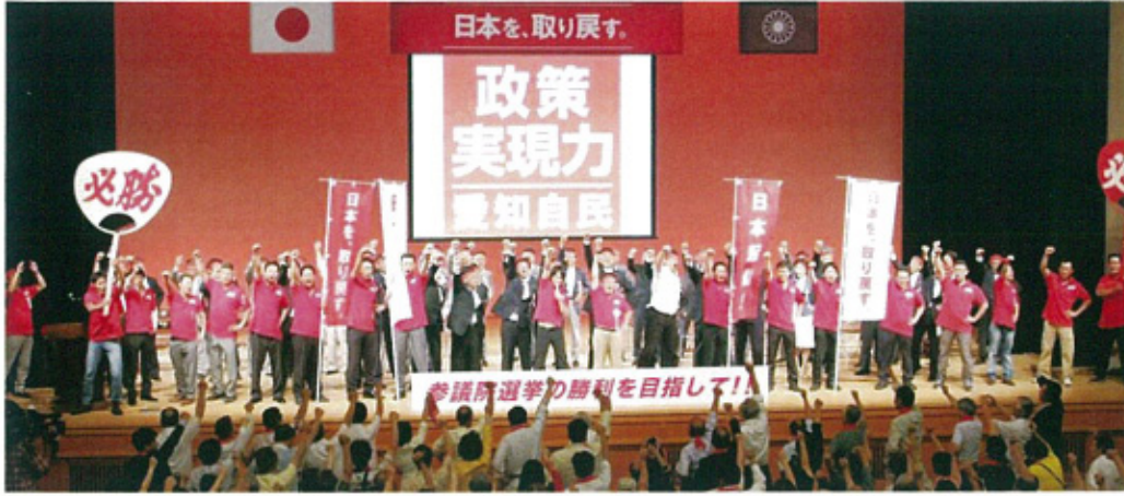
自由民主党愛知県連政談演説会にて一致団結必勝を期す