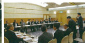
地域連絡会議にて地域政策要望聴取