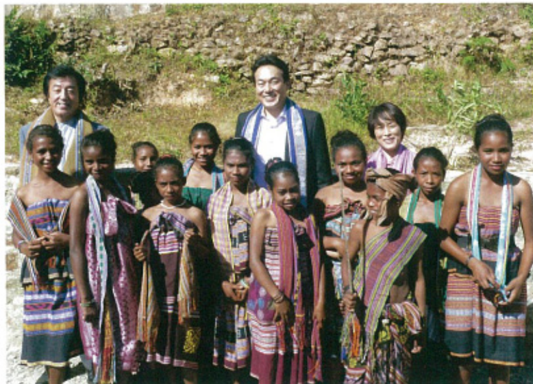
東ティモール・ダルラウ小中一貫校訪問