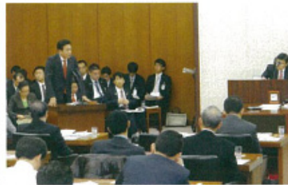
衆院厚労委員会での国会質疑に対する政府答弁