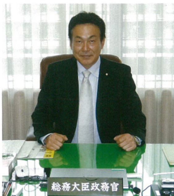
総務省の政務官執務室にて