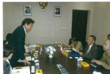
インドネシア・ウィスマナ国家開発企画庁次官との会談