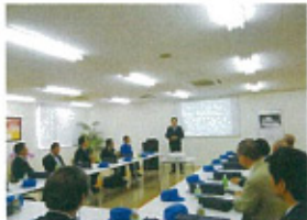
「明日の愛知を創る会」研修行事