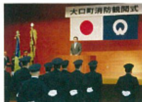
各地の消防観閲式等で激励