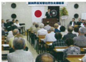
自民党各地域支部会合でご挨拶