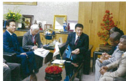
ボツワナ共和国運輸通信大臣との意見交換