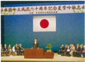
日本詩吟正風流60周年記念夏吟詠大会