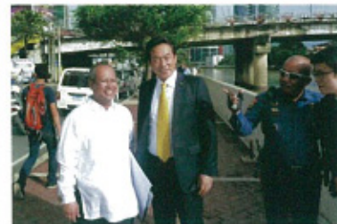
フィリピン・マリキナ河川改修計画現況視察