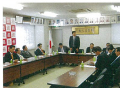
自民党愛知県連執行部会議にて今後の取り組みを協議