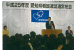
平成25年度愛知県看護連盟総会 名古屋税理士政治連盟 第40回定期大会