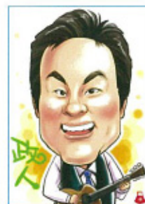
愛知県扶桑町の元材木商の長子として 頂上選手「アスリート」

生年月日 昭和35年7月8日(現53歳) 趣味 ギター弾き語り 信条 「初心不可忘」「夢人声」「敬は道」