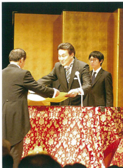
総務省主催の「平成25年秋の叙勲伝達式」

スを担保するということは、本当に国に与えられた大切な仕事であります。そして、経済を再生する、ICTを含め情報戦略をどういう形で確立をしていくか、日本国内のみならず、国際的にもどう展開できるか、日本の有する技術力をしっかりと広めていく、そしてそれを日本の国力の大きな向上につなげていく、そのような仕事をしっかりと全うして参りたいと決意いたしております。