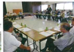
政策懇話会にて友好団体との意見交換