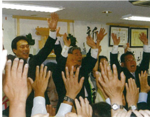
投票日当日に選挙事務所でご当選のバンザイ