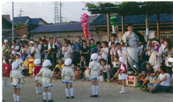
県内各地の盆踊り等の地域行事に参加して挨拶