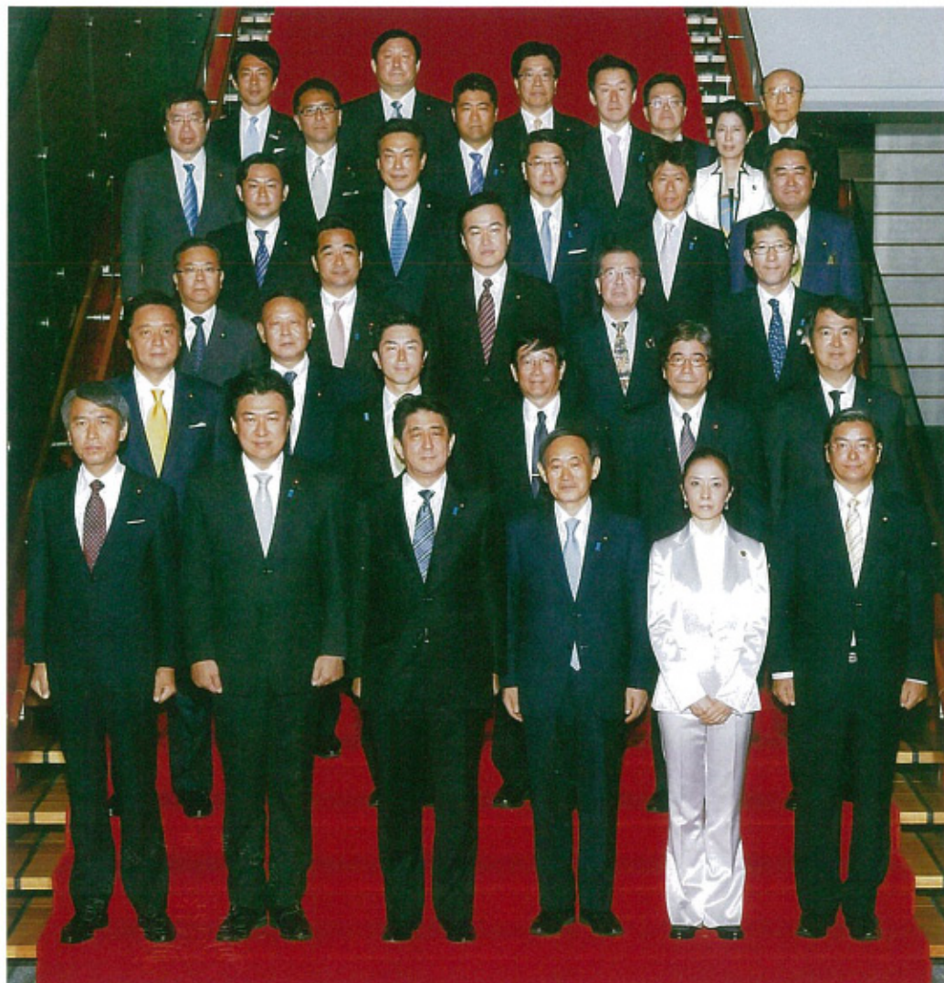
辞令交付後の総理官邸にて (前から4列目、左から2人目)