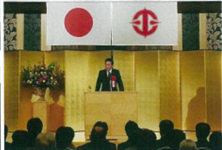
名古屋税理士政治連盟定期大会 愛知県中小企業団体連合会大会にて愛知県の経済再生を誓う